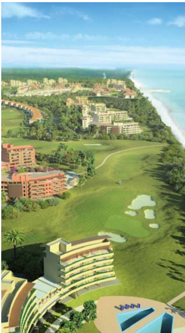
“Campeche Playa Golf Marina & SPA Resort” del Grupo Mall

La riqueza ecológica de Tamaulipas tiene a su exponente en la reserva de la biósfera “El Cielo”, reconocida por la Unesco en 1987 como patrimonio de la humanidad, y donde es posible ver ecosistemas que van desde el desierto hasta los bosques húmedos. Otro habitante del estado digno de visitar es la tortuga Lora, de color verde y que llega a medir 90 centímetros, una especie endémica de Tamaulipas, único lugar en el mundo donde se puede apreciar, y cuya particularidad es que es la única tortuga que anida en el día y no en la noche.